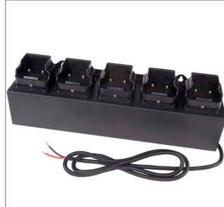
Cargador de cc para 5 bancos: luces angulares intrant™ recargables