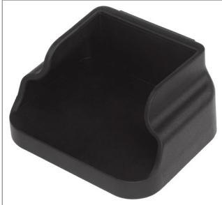
Base magnética con clip para luces angulares intrant®