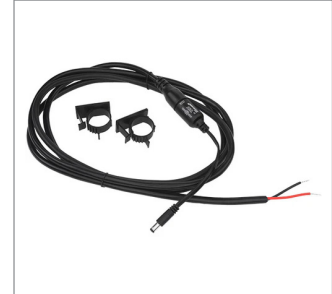
Kit de cableado directo - 12 v