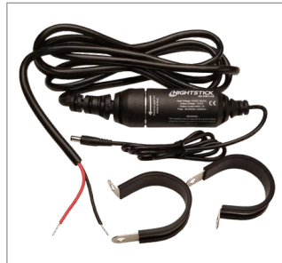
Kit de cableado directo de 12-36 voltios